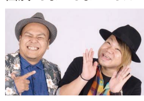
出演/ゴリラ・コーポレーション