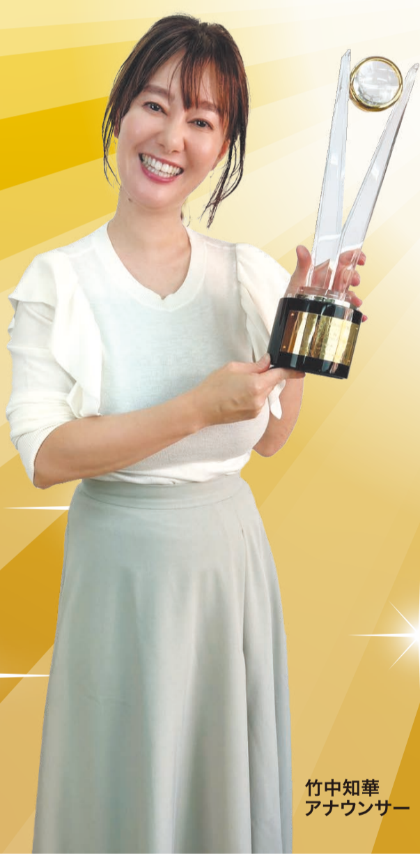
竹中知華 アナウンサー