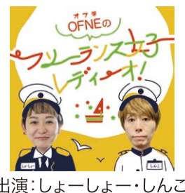
出演:しよーしよー・しんこ

そう、例えるなら気負ってない、普通に近い女子トークをひたすら立ち聞きしてる感じ! そして僕のお勧めの聞き方は1.5倍速で聴く!これはねポッドキャストならではの聴き方!あ、別にパーソナリティの2人がゆっくり喋ってるから倍速で聴いてるとかじゃないよ! 最近のマイブームで、YouTubeだろうがNetflixだろうがなんでも1.5倍速で聴いてる癖で、この番組もその速さで聴いてみたら良かったってだけ!ゆるいのが良いけどテンポ感は欲しいってゆう僕のワガママを叶えてくれるポッドキャストってマジで最高だ!!だ・か・ら、この聴き方はお勧めだ! しばらくの間、僕のポッドキャスト熱が冷めないなあ。みんなも1度はラジオ沖縄のオリジナルポッドキャストを聴いてみて!